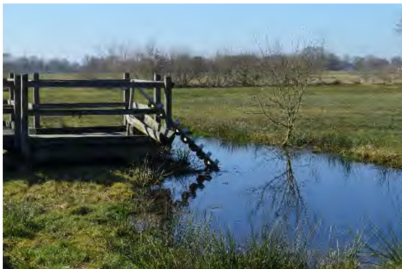
Archimedische Schraube

Der Rundweg der Beerster Wischen führt Sie vom Parkplatz aus über einen Bohlensteg vorbei an Infotafeln, Gräben und Schafen. Unterwegs gibt es die Möglichkeit, mit einer Archimedischen Schraube, das Element „Wasser“ hautnah zu erleben.