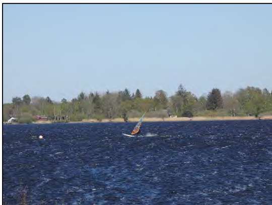
Natur und Wassersport

Der Flögeler zeigt beeindruckend die Kontraste aber auch das Zusammenspiel zwischen Naturschutz und touristischer Erholungsnutzung - Vom Aussichtsturm am östlichen Ufer lassen sich sowohl Surfer als auch Vögel ungestört beobachten.